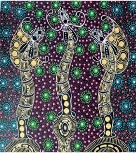
"Dreamtime Sister" by C. W. Nungari.