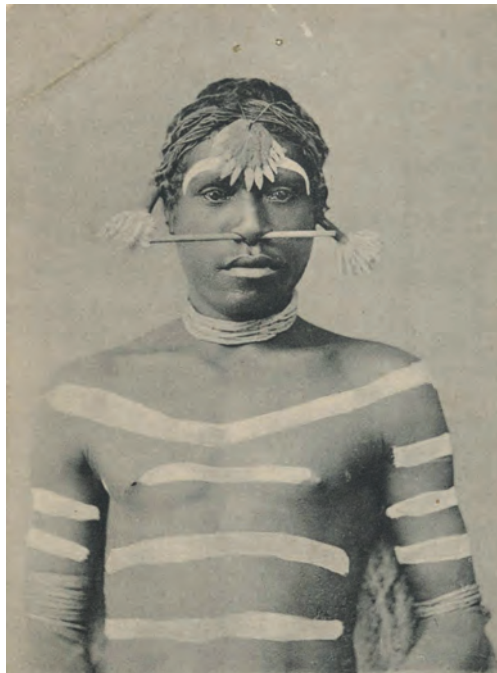
Portrait of Aboriginal chief, Barron River, Queensland, with body paint and head decorations, in ceremonial dress.

El arte indígena australiano tiene que ver con la unidad en la diversidad y la interdependencia de la naturaleza y los seres vivos. La gente del mundo puede beneficiarse enormemente del arte y la cultura de los indígenas australianos porque no solo nos inspira a vivir vidas más significativas y satisfactorias en armonía con los demás y con la naturaleza, sino que también nos muestra cómo esto es posible.