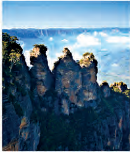
The Three Sisters, location Blue Mountains NSW Australia.